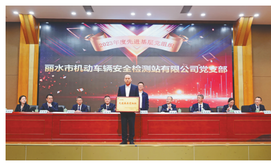
先进基层党组织:检测站党支部

2023年,是丽汽集团建司90周年,全体干部职工顶住外部激烈市场竞争压力、克服内部转型升级攻坚期重重困难,汇聚合力抓实抓好“深化改革年”“增效降耗年”重点工作推进和主要项目落地,较好地完成了各项工作任务。同时也涌现出一批先进单位、先进班组和先进个人。为更好的激励典型,弘扬先进,在第十五次股东大会上,对他们进行了隆重的表彰。