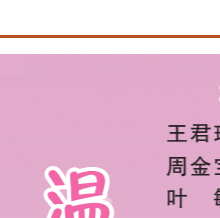
安全生产情况 本月安全无事故。

观看完这场活动,让我知道了爷爷和妈妈工作的单位原来也是从一家很小的公司,一步一步通过大家的努力成长为现在这么大的。也让我学到了很多做人的道理。其中有一位驾驶员伯伯,之前在大巴车上制服了持刀的男子,救下了整年的人,我觉得他非常勇敢,我也要向这位伯伯学习,做一个勇敢的人。